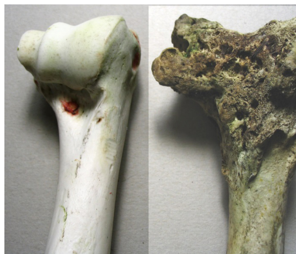
Ryc. 7. Przykłady zmian chorobowych w obrębie żuchwy hemuli oraz kości długich.

watych, powodowaną przez Gram-dodatnie bakterie Actinomyces sp. Ponadto, w omawianym regionie Patagonii ma miejsce deficyt selenu, pierwiastka którego niedobory są przyczyną obniżenia odporności, zakłóceń metabolizmu procesów kostnych, prowadzących do paradontozy, przyspieszonego ścierania się zębów i rzeszotowienia kości (FLUECK i SMITH-FLUECK 2008).