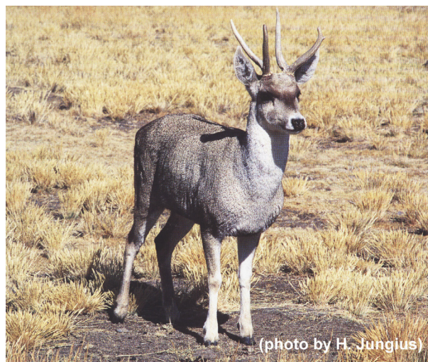
Ryc. 9. Młody byczek taruki.

Obecna liczebność populacji hemula jest bliska krytycznej. Z tego powodu istnieje pilna potrzeba utworzenia banku nasienia tego gatunku, jako rezerwy genetycznej. Posiadanie żywych gamet, w skrajnym przypadku może pozwolić na zastosowanie nowocze-