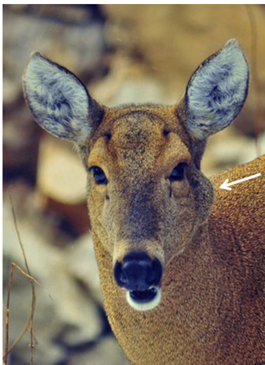
Ryc. 8. Podskórne zmiany patologiczne w obrębie szczęki.

lub żuchwy, świadczą o rozwijającej się promienicy (Ryc. 8).