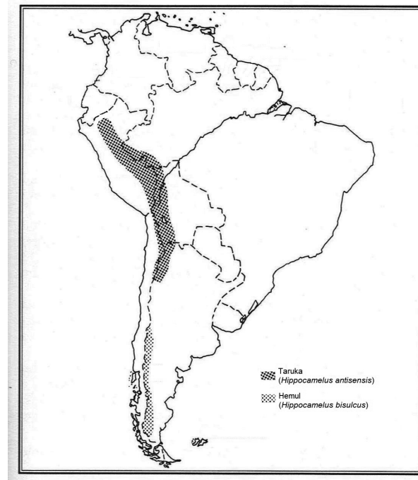
Ryc. 2. Rozprzestrzenienie hemula i taruki w Ameryce Południowej (wg Whitehead 1993, zmieniła).

Jest to olbrzymi teren i przy małej liczebności zwierząt szacuje się ilość grup rodzinnych na około 100, z których 65% występuje poza rezerwatami i parkami narodowymi, gdzie nie są objęte ścisłą ochroną (VILLA i współaut. 2006). Według innych obserwacji liczba subpopulacji jest znacznie niższa i wynosi około 50 (FLUECK i SMITH-FLUECK 2006). Na terenie Chile spotyka się hemule głównie w części zachodniej, wzdłuż wybrzeża Pacyfiku. Ze względu na górzyście ukształtowanie terenu, występują one od poziomu oceanu do powyżej 3.000 metrów n.p.m., zarówno na płaskich, trawiastych dolinach, jak i na brzegach zalesionych skłonów gór, w których dominującymi gatunkami drzew są bukany ( Nothofagus spp.), odpowiedniki buka z półkuli północnej. Szacuje się, że hemule wykorzystują jako pokarm do 120 gatunków roślin, w których, poza trawami i ziołami, dominują gatunki z rodzaju Maytenus sp., z rodziny dławiszowatych, w formie drzew lub krzewów, Alstroemeria sp., 65 gatunków roślin jednoli-