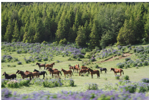
Ryc. 6. Hodowla koni w środowisku typowym dla hemuli.

kimi wawozami utrudniającymi zbieranie informacji.