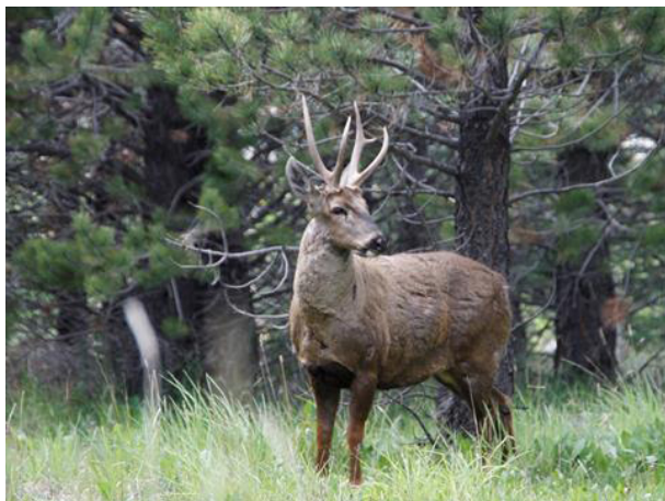
Ryc. 1. Młody byczek hemula w środowisku naturalnym Patagonii

Gatunek ten, żyjący w południowej Argentynie i Chile, szacowny jest obecnie odpowiednio na 350–500 i 1000 sztuk i jego liczebność wykazuje od dekad stałą tendencję spadkową. Obecna populacja wynosi 1% historycznej liczebności tego jelenia, a ich grupy rodzinne zwykle nie przekraczają 11 sztuk. Są to grupy niewielkie biorąc pod uwagę, iż w przeszłości grupy te liczyły ponad 100 sztuk i były spotykane nawet na