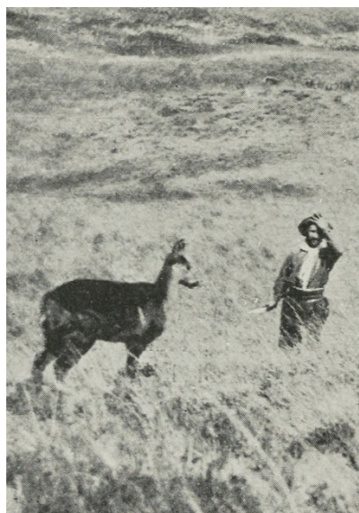
Ryc. 4. Bliski kontakt Gaucho z łanią hemula

Cechą sprzyjającą nielegalnemu pozyskiwaniu hemula jest jego brak strachu przed człowiekiem. Zwierzęta te, zarówno łania, jaki i byczki, pozwalają podejść do siebie w warunkach naturalnych na odległość ok. 5 metrów. Ta cecha wśród zwierząt wolnożyjących jest niezwykle rzadka, dla ludzi wrażliwych jest miła i wywołująca sympatię, natomiast u innych wyzwala chęć zabijania (Ryc. 4, 5). Pomimo istnienia kłusownictwa, dane dotyczące liczby utraconych zwierząt