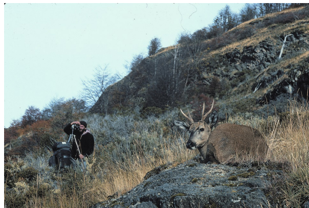
Ryc. 5. Brak strachu hemula przed człowiekiem jest niezależny od płci.

są dość spekulacyjne. Dla przykładu, w Narodowym Parku Tamango w latach 2005-2007 zanotowano śmiertelność 19 sztuk dorosłych hemuli, przy czym upadki spowodowane przez psy wynosiły 2 sztuki, z powodu kłusownictwa i drapieżnictwa pumy utracono 8 sztuk, natomiast 9 sztuk zaginęło. W latach 2008-2015 śmiertelność wyniosła 21 sztuk, z czego 1 sztuka padła z powodu starości, 4 zostały zabite przez psy, 4 przez pumę, a 12 sztuk zaginęło (TOMPKINS CONSERVATION BOLETIN VIDA SILVESTRE 2016). Prawdopodobnie, w tym wykazie, zwierzęta sklusowane zawarte są w grupie „zaginione”. Pewnym wytłumaczeniem trudności w szacowaniu liczby utraconych zwierząt jest często olbrzymi teren poddany poszczególnym obserwacjom (np. wielkości naszego województwa) oraz wysokie góry poprzecinane głąbo-