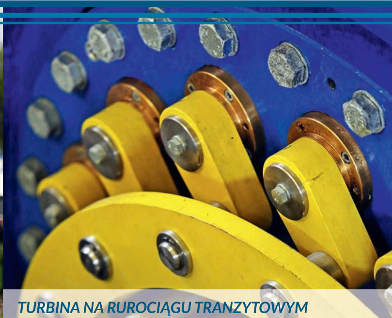
TURBINA NA RUROCIĄGU TRANZYTOWYM